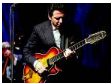
Sul palco John Pizzarelli

Per comprendere l'exploit, va ricordato che il prezzo del biglietto per questo tipo di eventi è maggiorato (quasi raddoppiato) rispetto a quello mediamente pagato per un normale spettacolo.