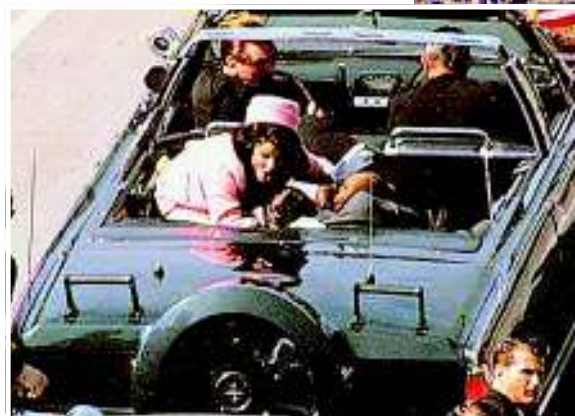
Col presidente Al centro, Jackie assieme a John Fitzgerald Kennedy e, sopra, l'assassinio a Dallas